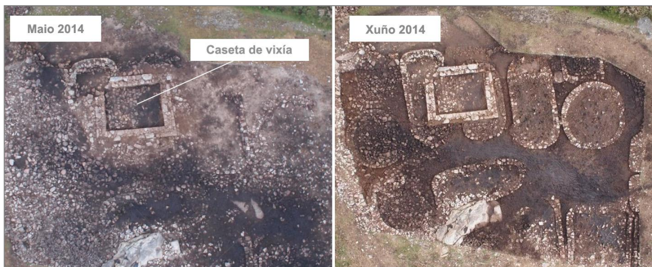
Vista aérea da evolución das escavacións do ano 2014, onde se pode apreciar a caseta de vixía enriba das vivendas castrexas.

Unha serie de postos de vixilancia, tamén denominados casetas-vixía ou fachos, por mor do sistema de fogueiras que se prendían neles como método de comunicarse cos outros postos, facían que en pouco tempo, as noticias dunha incursión inimiga chegara dende as Rías Baixas ata a Coruña ou O Ferrol, facendo así que os barcos da nosa Armada estiveran dispostos a repeler os citados ataques o máis axiña posible.