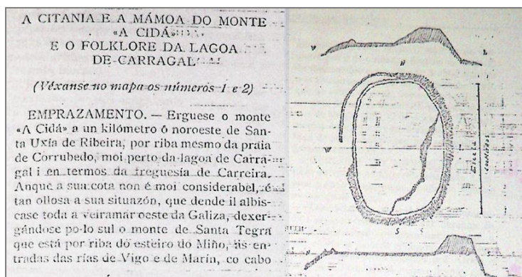
Fragmento da obra «Prehistoria e folklore da Barbanza», do ano 1927.