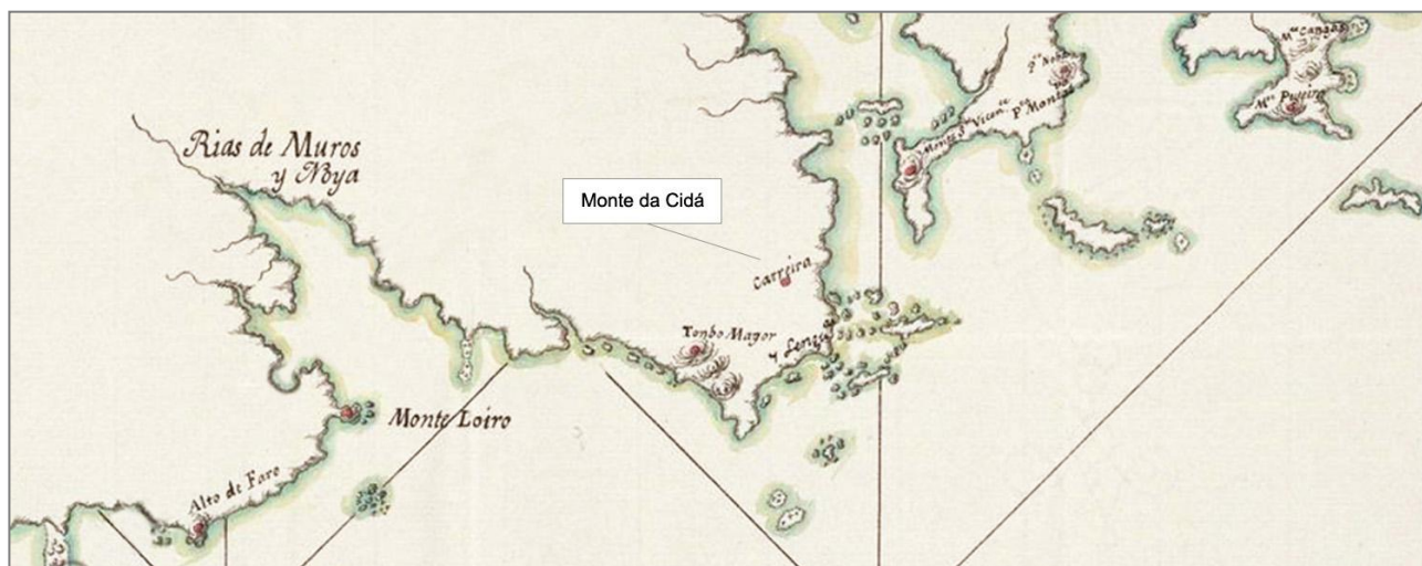
Descripción de la Costa y Puertos que se comprenden desde la Ría de Vigo hasta la Capital de La Coruña... (Fragmento). Ano 1798.

A investigación posterior permitiu aclarar que tipo de vivenda era a citada construción, pois uns documentos de finais do século XVIII estudados polo director da escavación Miguel Vidal, facían alusión por parte do Capitán Xeral do Reino de Galicia, a establecer postos de vixilancia nos cumes dos montes da costa galega para establecer puntos de control do tráfico marítimo e poder así alertar dos intentos de incursión dos navíos inimigos (sobre todo a flota inglesa), nun contexto de guerra entre a coroa española e británica.